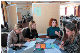
Specifični ToT za trenere iz BiH, Albanije i Crne Gore