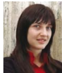
Dr Nina Vujošević, predsjednik radne grupe za izradu Zakona o regionalnom razvoju, Ministarstvo ekonomije

vrstavanje jedinica lokalne samouprave prema stepenu razvijenosti i njihovo rangiranje prema stepenu konkurentnosti, subjekte regionalnog razvoja, podsticanje ravnomjernijeg regionalnog razvoja, kao i finansiranje regionalnog razvoja. Takodje, Predlog Zakona definiše i podjelu na regione koji nijesu administrativne jedinice i nemaju pravni subjektivitet, već se definišu kao teritorijalne cjeline, koje se sastoje od više jedinica lokalne samouprave i koji su uspostavljeni za potrebe analize, planiranja i sprovođenja politike regionalnog razvoja. Predlog Zakona predviđa i osnivanje Partnerskog savjeta za regionalni razvoj, kao savjetodavnog tijela koje se osniva u skladu sa načelom partnerstva i saradnje i koje utvrđuje prioritete u realizaciji razvojnih projekata od regionalnog značaja. Generalno, Strategija regionalnog razvoja i Zakon o regionalnom razvoju treba da otvore mogućnosti prepoznavanja i podsticanja razvojnih potencijala u različitim djelovima Crne Gore. Donošenjem Zakona o regionalnom razvoju će se započeti sa uspostavljanjem mehanizma za koordinaciju i sprovođenje politike regionalnog razvoja i mjerenje efekata aktivnosti svih subjekata regionalnog razvoja na stepen razvijenosti tj. ravnomjerniji razvoj jedinica lokalne samouprave i ubrzaniji razvoj manje razvijenih jedinica lokalne samouprave, a sve u cilju povećanja kvaliteta života u Crnoj Gori. ■